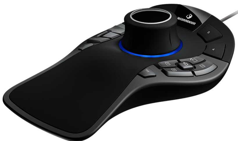
3D-манипулятор SpaceMouse Pro